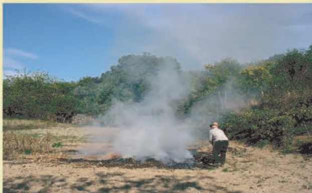
Queima de sobrantes

Uso de fogo para eliminar sobrantes de exploração agrícola ou florestal, cortados e amontoados.