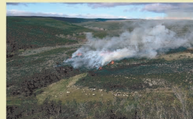
Queimadas para renovação de pastagens

Uso de fogo para renovação de pastagens e eliminação de restolho e ainda, para eliminar sobrantes de exploração cortados mas não amontoados.